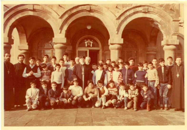
ԻՄ ԱՇԱԿԵՐՏՆԵՐԸ ՎԱԶԳԵՆ ՎԵՀԱՓԱՌԻ ՀԵՏ, ՆՈՐ ՎԵՀԱՐԱՆԻ ԱՌԱՋ, 1991թ.