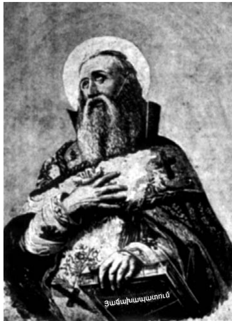
Սուրբ Գրիգոր Լուսավորիչ

Ծերերի պսակը բազմահատուկյունն է և նրանց պարծանքը՝ երկյուղը Աստծուց (Սիրաք 25:8)