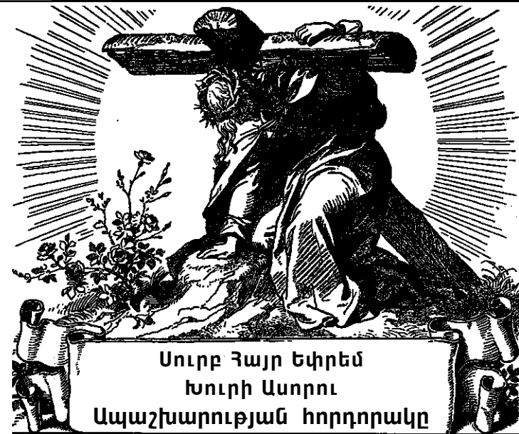
Սուրբ Հայր Եփրեմ Խուրի Ասորու Ապաշխարության հորդորակը

Այն Օրը և ինձ ընդունիր, Տե՛ր, Քո արդարների և կատարյալների հետ, կարգիր աջակողմյան դասում, պսակիր Քո սուրբերի հետ, շնորհիր ինձ հավիտենական կյանքը և պարզեիր ինձ Քո անճառ բարիքները... և զուգահավասար դարձրու՝ Քո սուրբերին՝ միշտ արժանավայել օրհնաբանելու, հանապազ պայծառացրու՝ Քո աստվածային անսովեր լույսով: Եվ անդադար երգով կփառավորեն Ամենասուրբ Երրորդությանդ այժմ և հավիտյանս հավիտենից: Ամեն (Եփրեմ Ասորի):